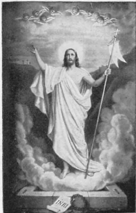
H Seb K

Barmherziger Jesus, gib ihm die ewige Ruhe! (300 Tage Ablass)