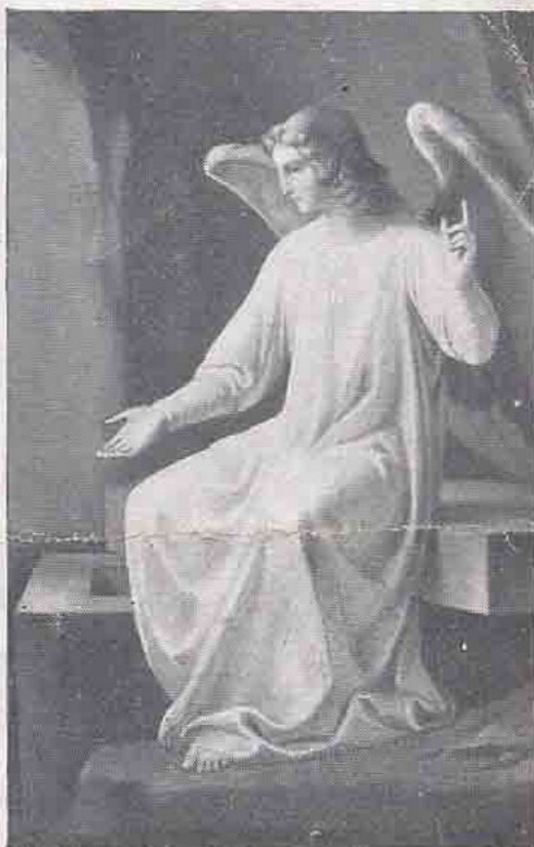
H. Sch. K.

Barmherziger Jesus, gib ihm die ewige Ruhe! (300 Tage Ablass)