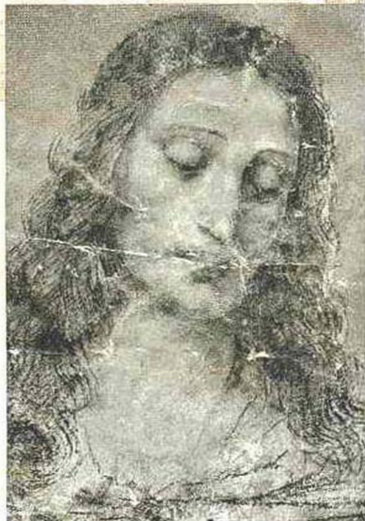
LEONARDO DA VINCI

Druck: Fritz Hartmannsgruber, Bogen/Donau